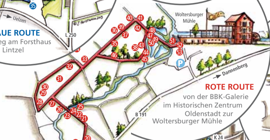
ROTE ROUTE von der BBK-Galerie im Historischen Zentrum Oldenstadt zur Woltersburger Mühle