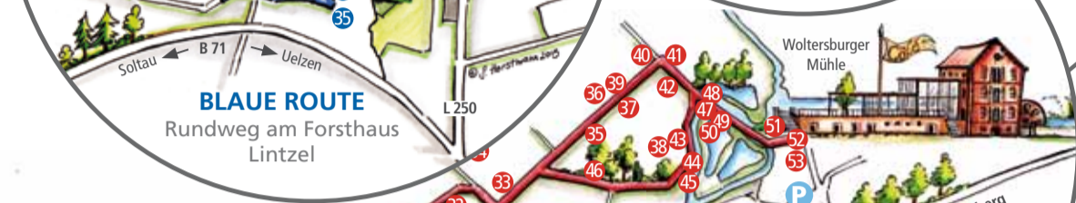
BLAUE ROUTE Rundweg am Forsthaus Lintzel