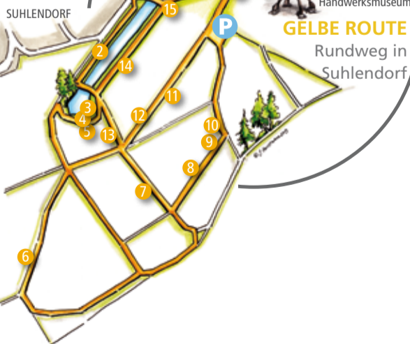
GELBE ROUTE Rundweg in Suhlendorf