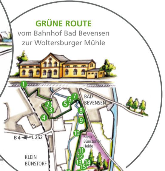
GRÜNE ROUTE vom Bahnhof Bad Bevensen zur Woltersburger Mühle

BBK-Galerie Historisches Zentrum Oldenstadt